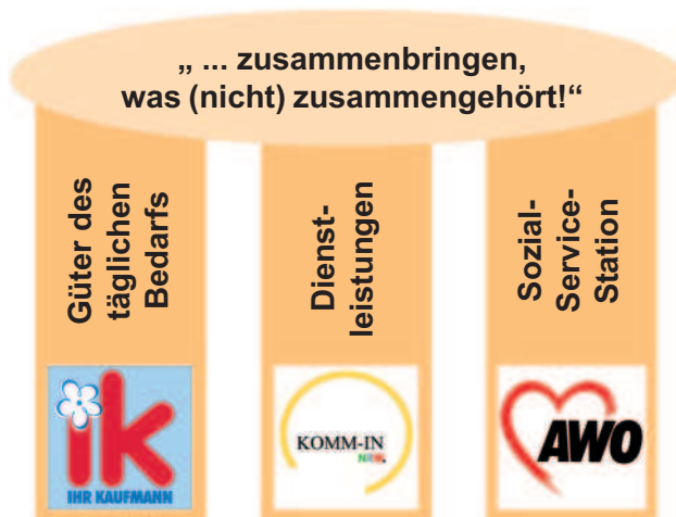
Abb. 1: Drei Säulen des DORV-Zentrums