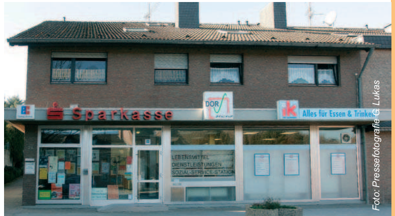
Neuer Dorfmittelpunkt und Kommunikationsort, zusätzlich beherbergt das Zentrum eine Zahnarztpraxis

Die Geschichte des DORV-Zentrums begann 2001 mit dem Schließen der ehemaligen Sparkassenfiliale in Barmen, nachdem die Grundversorgung für die Bürger bereits in allen anderen Bereichen nach und nach zurückgegangen war. Viele kennen das Problem, vielleicht sogar aus dem eigenen Ort: Der kleine Laden, in dem man schon als Kind seine ersten Bonbons erstanden und später seine Einkäufe getätigt hat, hängt ein Schild an die Eingangstür. „Wir schließen nach langjähriger Tätigkeit unser Geschäft zum ...“. Das betroffene Dorf und seine Bewohner haben damit oft nicht nur einen Lebensmittelladen, sondern einen wichtigen Wirtschafts- und Kommunikationsmittelpunkt verloren. Vor einer ähnlichen Situation stand Jülich-Barmen. Nach dem Schließen der Sparkassenfiliale war der Ort zu einem reinen „Schlafdorf“ verkümmert. Die Barmener wollten sich aber mit dieser Situation nicht abfinden und so entstand in der Bürgerschaft die Idee, die Wiederherstellung der dörflichen Grundversorgungsinfrastruktur selbst in die Hand zu nehmen. Schnell war klar, dass dafür nicht auf bestehende Konzepte zurückgegriffen werden konnte, sondern völlig neue Wege beschritten und ein gänzlich eigenes Modell entwickelt werden musste. Nach drei Jahren intensiver Vorarbeit eröffnete das DORV-Zentrum am 9.9.2004.